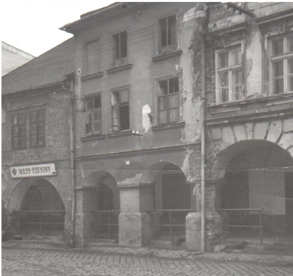
městský dům čp. 15 na Zámeckém náměstí č. 3 v Krnově, stav v roce 1963